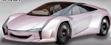
ナノセルローズヴィークル