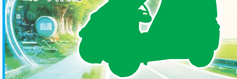
静岡県産木材等を使用したコンセプトカー