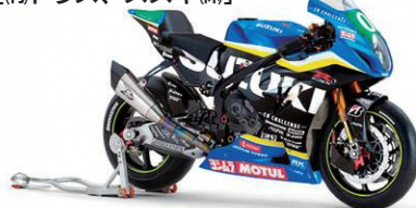
チームスズキCNチャレンジ車両